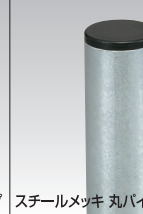
スチールメッキ丸パイプ・キャップ