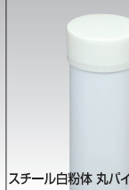
スチール白粉体丸パイプ・キャップ