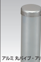
アルミ丸パイプ・アルミキャップ