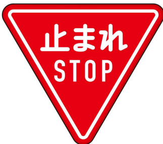
9602740 894-23B 三角標識 800 平リブ2本