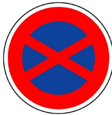
9602722 894-13 標識 600φ 平リブ2本