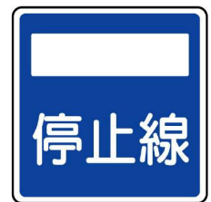
9602735 894-25 標識 600X600 平リブ2本