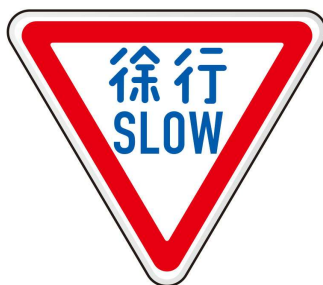
9602741 894-22B 三角標識 800 平リブ2本