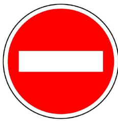
9602721 894-03 標識 600φ 平リブ2本