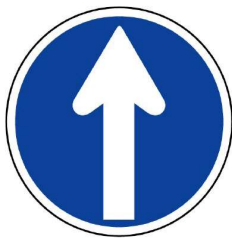
9602730 894-08 標識 600φ 平リブ2本