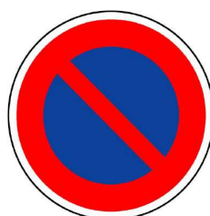
9602723 894-14 標識 600φ 平リブ2本