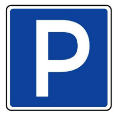
9602734 894-24 標識 600X600 平リブ2本