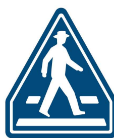
9602742 894-26 五角標識 600 平リブ2本