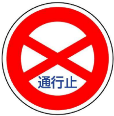
9602720 894-01 標識 600φ 平リブ2本